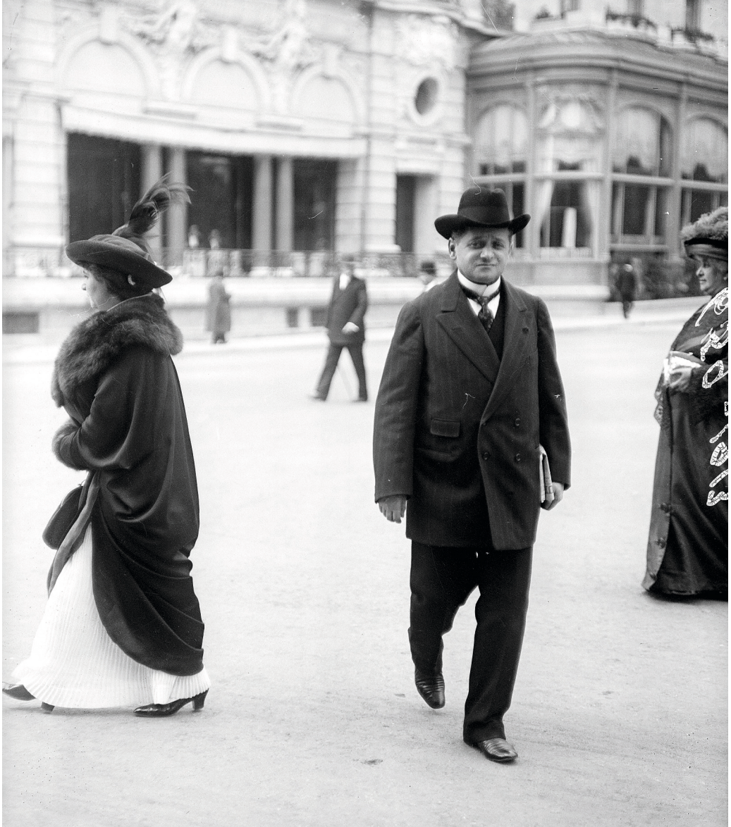
Raoul Gunsbourg sortant de l'Hôtel de Paris et traversant la place du casino, Monte-Carlo 1913.