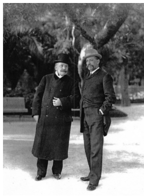
Jules Massenet et Albert I er déambulant dans les jardins du palais princier, Monaco 1907.