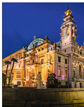
Façades Sud-Ouest et Sud-Est de l'Opéra de Monte-Carlo.