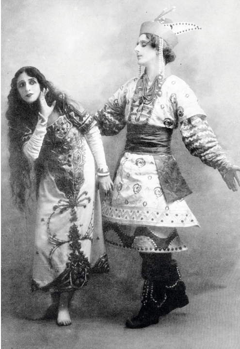
Vera Fokina et Michel Fokine dans L'Oiseau de feu en 1910.